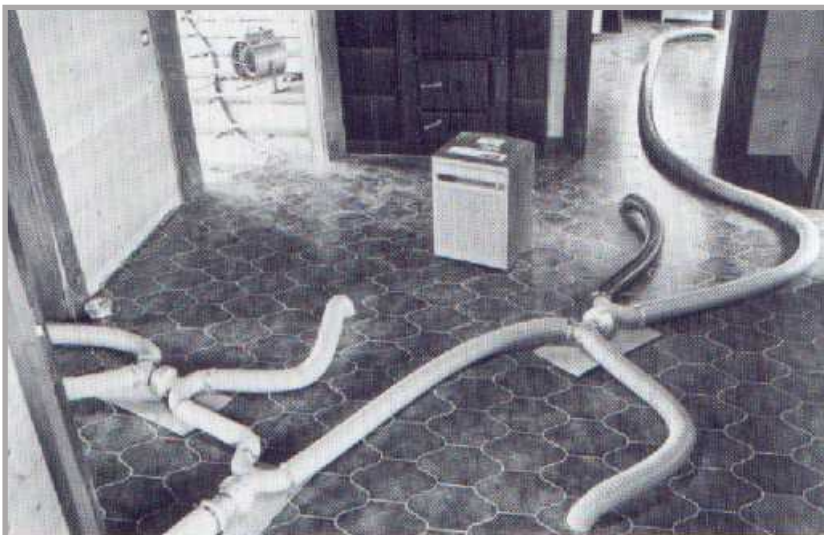
Obr.2 - Havárie na vodovodním potrubí v rodinném domku

Díky odvlhčovací metodě firmy SEN lze vysušit tepelnou izolační vrstvu, aniž by muselo dojít k znehodnocení drahé podlahové krytiny.