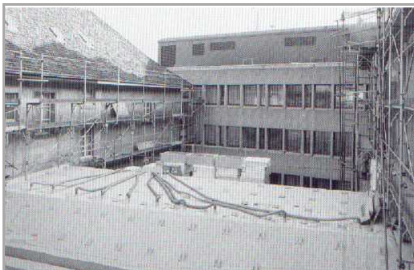
Obr.3 - Sanace promočené tepelné střešní izolace odvlhčovací metodou firmy SEN

Díky odvlhčovací metodě firmy SEN lze vysušit tepelnou izolační vrstvu, aniž by muselo dojít k znehodnocení drahé podlahové krytiny.